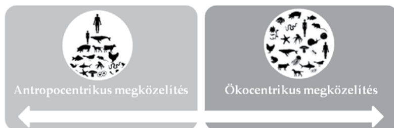
1. ábra. A környezet és az ember kapcsolatát vizsgáló nézetek két pólusa

Az emberi jogok, valamint a környezet minősége és védelme között egy komplex összefüggésrendszer található, amely a jogtudományban már széles körben bizonyított és elfogadott. 4 Az emberi jogok az emberi élet és méltóság feltétlen tisztelésén alapulnak, míg a környezetvédelem célja a környezet állapotának fenntartása és/vagy javítása. 5 Az ember számára a környezetvédelem és az emberi jogok védelme is kívánatos, mivel azok jobb életfeltételeket és életkörülményeket biztosítanak. Az ember pusztá létezése, valamint életének minősége az élhető bolygó fenntartásától is függ, így a környezetszennyezés veszélyeztethet, illetve csorbíthat bizonyos emberi jogokat. Az ember számára egészséges környezet léte számos emberi jog előfeltétele is egyben, gondoljunk csak az élethez, az egészséghez, a magán- és családi élethez vagy a tulajdonhoz való emberi jogokra. A környezet és az ember, valamint ezzel párhuzamosan a környezeti jogok ( környezethez való alanyi jog, környezeti kérdések esetében információhoz való jog, döntéshozatalban való részvétel joga, valamint az igazságszolgáltatáshoz való jog ) és az emberi jogok kapcsolatát taglaló nézetek alapvetően két pólus körül és között helyezkednek el, amelyeket leegyszerűsítve antropocentrikus, valamint ököcentrikus megközelítésnek szokás nevezni.